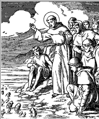
La prédication de saint Antoine aux poissons.

Sa santé a toujours été très mauvaise mais, en mars 1231, sa fatigue est telle qu'il doit s'arrêter. Il meurt le 13 juin 1231 à l'âge de 36 ans. Ses obsèques sont triomphales et il est canonisé en 1232 (un an plus tard !) par le Pape Grégoire IX. Déjà nombreux de son vivant, les miracles obtenus par son intercession se multiplient après sa mort. Saint national du Portugal, il sera nommé docteur « évangélique » de l'Église par le pape Pie XII en 1946, tant il était imprégné des Écritures ! Sa fête est commémorée le 13 juin.