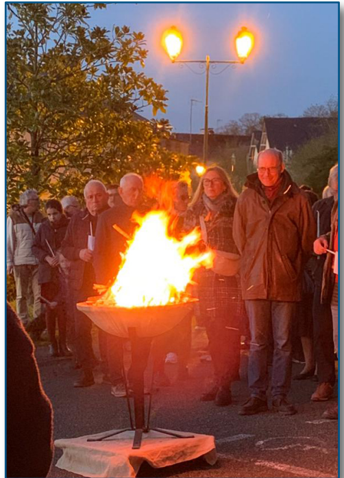
Veillée pascale 2026 à Montsûrs

La Semaine Sainte a rassemblé une assistance nombreuse le soir du Jeudi Saint pour commémorer l'Institution de l'Eucharistie et le lavement des pieds ; beaucoup de ferveur encore le Vendredi Saint pour l'Office de la Passion et la vénération de la Croix ; enfin une très belle célébration pascale dans la nuit du Samedi Saint : à la lumière des cierges