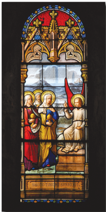
Église de Montsûrs.

et au son des cloches, nous avons alors laissé éclater nos Alleluia et nos hymnes triomphantes, soutenus par une chorale bien maîtrisée et résonnant joyeusement sous les voûtes de l'église.