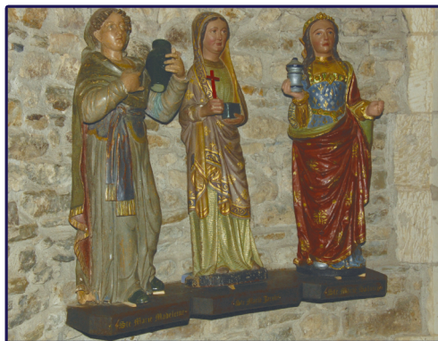
Église de Montsûrs.

PS – Merci également à tous ceux qui ont contribué à leur bon déroulement : lecteurs, animateurs, chanteurs, organiste, équipes de ménage, de sacristie... et merci aux nombreux enfants pour leur présence !